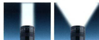
Haz de luz ajustable