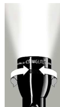
Haz de luz potente y enfocado