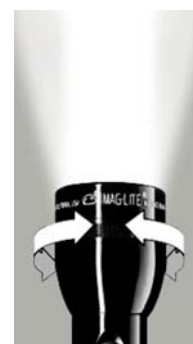
Haz de luz potente y enfocado